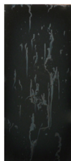
Sample A 試験片A