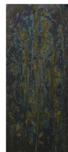
Sample B 試験片B