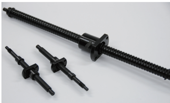
写真 A-111：黒クロム処理品 Photo A-111：Black Chrome coating