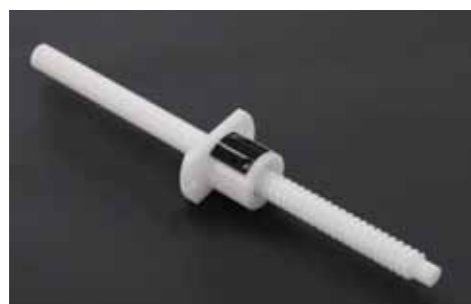
プラスチック製ボールねじ Plastic Ball Screw

指導：静岡理科大学 機械工学科 大塚二郎教授 Collaboration with Otsuka laboratory Shizuoka Institute of Science and Technology