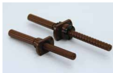
ベスベル®ボールねじ Ball Screw made from Vespel®