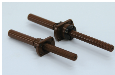
ベスペル®ボールねじ Ball Screw made from Vespel®

ベスペルはデュポン社の登録商標です。 Vespel is Dupont registered trade mark.