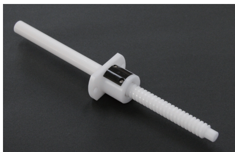
プラスチック製ボールねじ Plastic Ball Screw

指導：静岡理科大学 機械工学科 大塚二郎教授 Collaboration with Otsuka laboratory Shizuoka Institute of Science and Technology