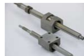
精密ボールねじのみ Precision Ball Screws only

取付け面を広く、ナットの中心と並行に設け、角型形状にしたタイプです。ナットそのものにハウジング機能を持たせたため、フランジ方式に比べコンパクトな設計が可能です。