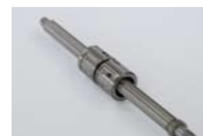
精密ボールねじのみ Precision Ball Screws only

円筒型ナットを2個使用し、中間にスペーサを入れ予圧を与えます。ナットの取付けは、円筒面に設けたキー溝とナット端面を利用して固定します。