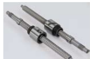
精密ボールねじ/転造ボールねじ Precision & Rolled Ball Screws

円筒型ナットの片側端面にメートルねじを設けたタイプです。ナットの取付けは、ナット端面のメートルねじを利用して行います。シリンダーなどを取付けるのに最適なナットです。