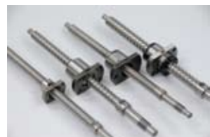
精密ボールねじ/転造ボールねじ Precision & Rolled Ball Screws

ナット1個の最も簡単なタイプです。通常わずかな軸方向すきまを与えて使用しますが、オーバーサイズボールを使用することで、軽予圧を与え、バックラッシュを無くすこともできます(精密級のみ)。ナットの取付けはフランジ部のボルト穴で行ってください。循環方式により、FBS(リターンプレート式)、FKB(こま式)、FDB(エンドデフレクタ式)、FEB(エンドキャップ式)などに区別できます。詳細は寸法表を参照ください。