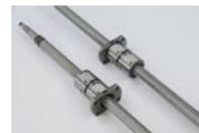
精密ボールねじのみ Precision Ball Screws only

2個のナットの間に予圧量分の厚いスペーサを入れ、軸方向すきまを除去するナットです。予圧を与えることにより剛性を高めることができます。ナットの取付けはフランジ部のボルト穴で行います。