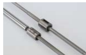
精密ボールねじ/転造ボールねじ Precision & Rolled Ball Screws

円筒型ナット1個のもので、径方向のコンパクトが実現しています。フランジ付きシングルナットと同様、軸方向すきまをゼロにすることもできます(精密級のみ)。ナットの取付けは、円筒面に設けたキー溝とナット端面を利用して固定します。