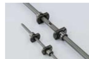
精密ボールねじのみ Precision Ball Screws only

1本のねじ軸に右ねじと左ねじの両方を加工することにより、開閉ねじとして機能します。ナットはフランジ付きシングルナットを規格化していますが、スリーブ型等も製作可能です。なお、左右のねじ位相管理も可能です。