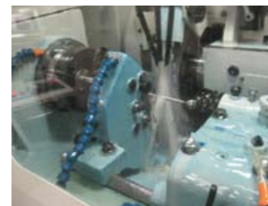
ねじ研削盤による高精度ねじ溝加工 High accurate shaft groove process by Grinding machine

KSSではお客様の要求精度により、ボールねじの製造工程が異なります。研削加工で高精度を確保する精密ボールねじ、ロールダイスによりねじ溝を成形する転造ボールねじに分類できます。一般にC5以上の精度等級は、研削加工(精密ボールねじ)で、精度等級C7、C10は、転造加工で対応しています。ロールダイス(転造加工の型)のない型式については、C7、C10でも研削加工で対応可能です。