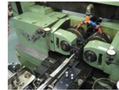
ロールダイスによる転造加工 Rolling process by Rolling dies